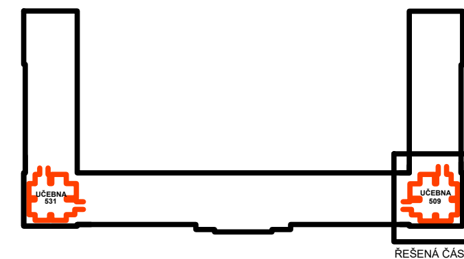
SCHEMA OBJEKTU PŮDORYS 5.NP